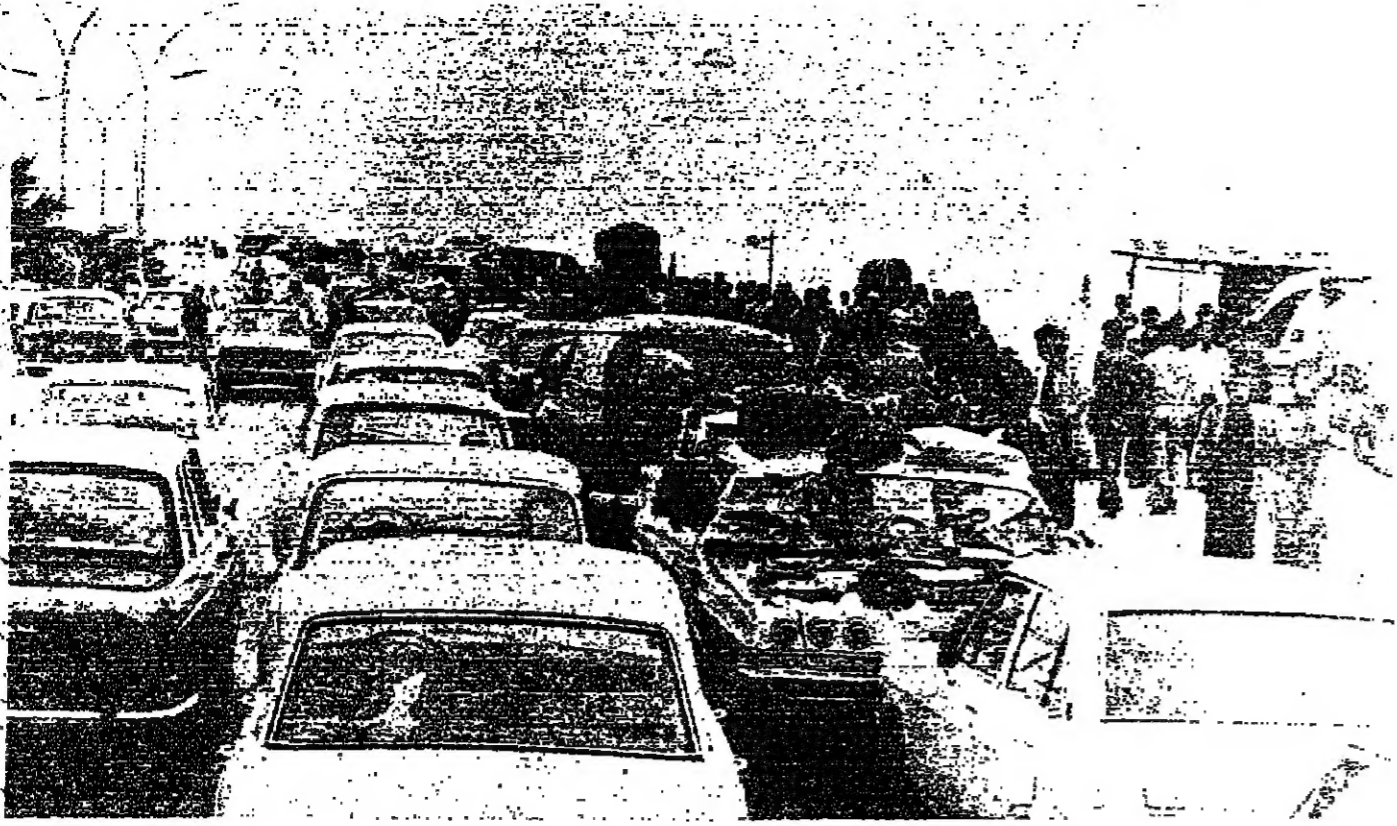
■ الباعة والمسرون في راحة غرداية

الكيلومترات من مناطق الإسكان حيث يفرش الوافدون على أنفسهم تجول حفاظا على حياتهم. وقد يوحى هذه الظاهرة بأقامة معارض للسطح في أماكن الإسكان - وربما يتخذ المتقانون إلى تجار أو شارين ■